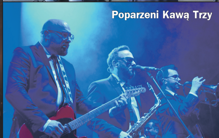
Poparzeni Kawą Trzy