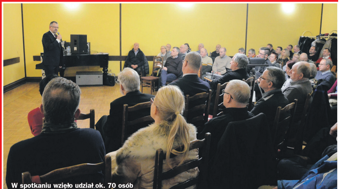
W spotkaniu wzięło udział ok. 70 osób