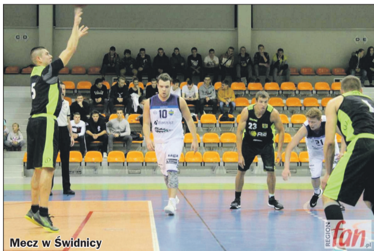
Mecz w Świdnicy

Mecze rozgrywane na obcym terenie stają się dla Rio Team prawdziwą piętą achillesową. W inauguracyjnym sezonie ligowym w wyjazdowych spotkaniach zło-