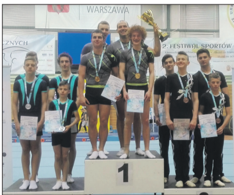
Złotoryjanie na podium