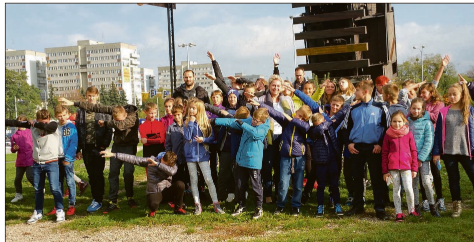
Uczniowie przed „Pociągiem do nieba”. W tle widoczny fragment pomnika