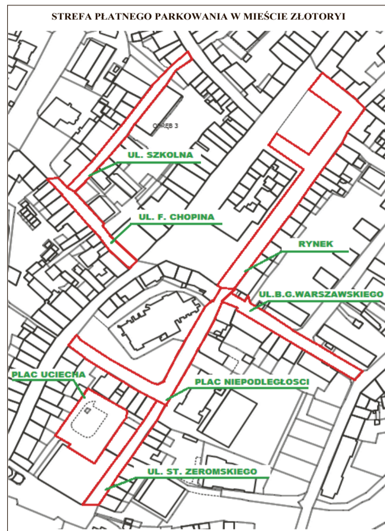
Po zmianie uchwały na październikowej sesji strefę płatnego parkowania tworzą następujące ulice i place: Niepodległości, Rynek, Uciecha (za osrodkiem kultury), Szkolna, Chopina, Żeromskiego i Bohaterów Getta Warszawskiego (zaznaczone na czerwono)