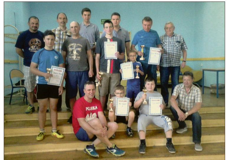
Najlepsi zawodnicy oraz organizatorzy turnieju