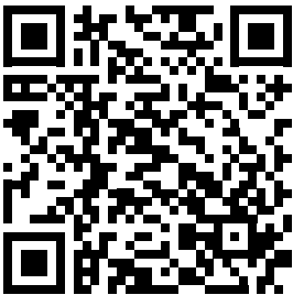
Wersja dla iOS

Wygenerowano z systemu kiedysmieci.info Wejd na stron https://kiedysmieci.info i pobierz bezpłatn aplikacj na swój telefon!